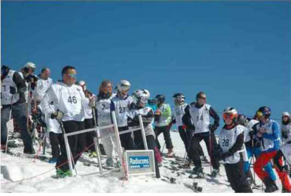
Les participants au départ du slalom. Les chefs au départ du slalom