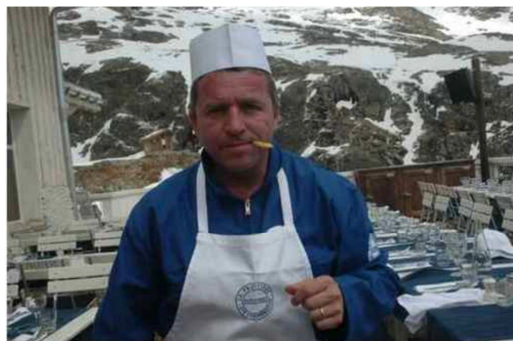
Le grand gagnant Edouard Loubet a revêtu le costume local de la Fruitière. Le grand gagnant Edouard Loubet a revêtu le costume local de La Fruitière

Une trentaine de chefs ont participé à l'épreuve