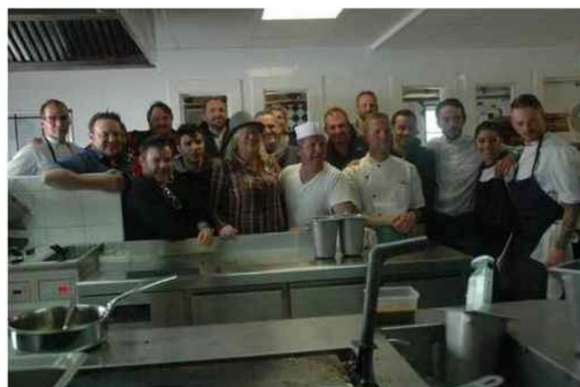
Les chefs étoiles ont visité la cuisine de la Folie Douce qui les a accueillis à 2300 mètres d'altitude.

Ophélie David, sur le stade Désire-Lacroix.